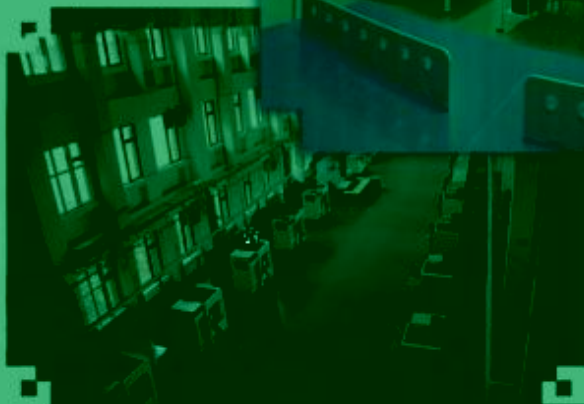
DMC 数控技术 训练场所